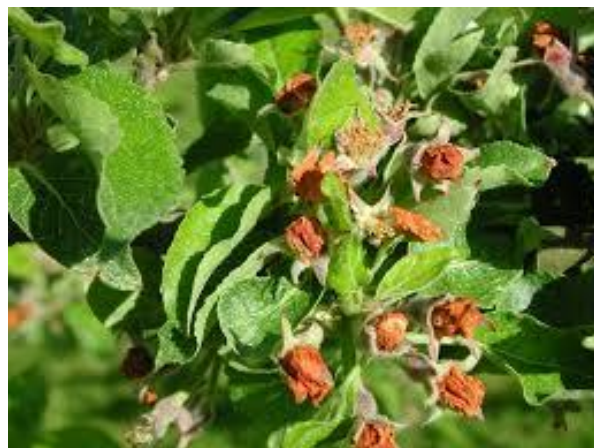
Bobocii florali afectati se numesc popular „cuisoare”

Oficiul Fitosanitar Vaslui recomandă efectuarea tratamentelor fitosanitare împotriva: Gărgărița florilor de măr ( Anthonomus pomorum ), Făinare măr ( Podospaera leucotricha ) T 1 - soiuri sensibile.